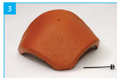
Rozdělovací hřebenáč s jedním vrutem Pro napojení hřebene a dvou nároží.