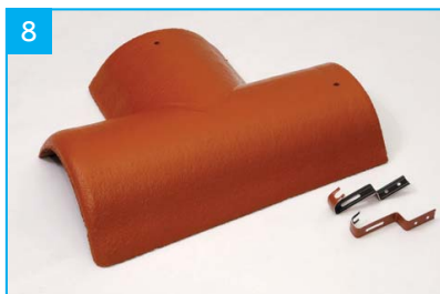
Rozdělovací hřebenáč levý T 220 se dvěma příchytkami Pro kolmé napojení dvou hřebenů v jedné rovině.