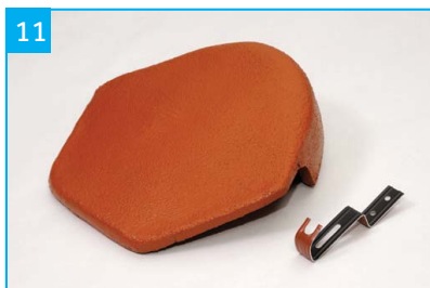
Uzávěra hřebene betonová s jednou příchytkou Pro zakončení hřebene sedlových střeš.