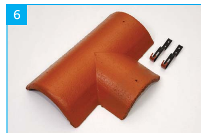
Rozdělovací hřebenáč pravý T 220 se dvěma příchytkami Pro kolmé napojení dvou hřebenů v jedné rovině.