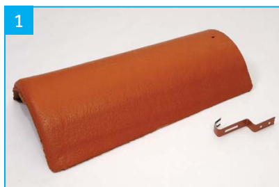
Hřebenáč s jednou příchytkou Pro pokrývání hřebene a nároží.