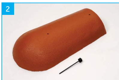
Koncový hřebenáč s jedním vrutem Pro spodní zakončení nároží.