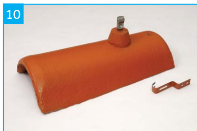
Hromosvodový hřebenáč s jednou příchytkou Pro upevnění vodiče hromosvodu na hřebeni a nároží.