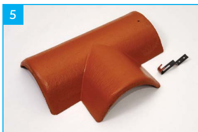
Rozdělovací hřebenáč pravý T 250 s jednou příchytkou Pro kolmé napojení dvou hřebenů v jedné rovině.