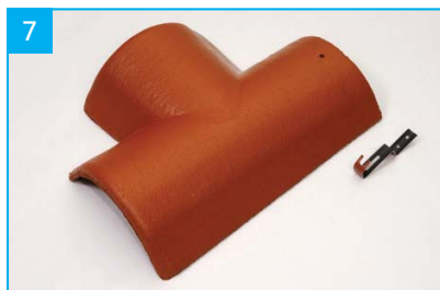
Rozdělovací hřebenáč levý T 250 s jednou příchytkou Pro kolmé napojení dvou hřebenů v jedné rovině.