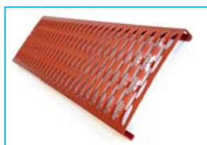
stoupací lávka 1,0 m