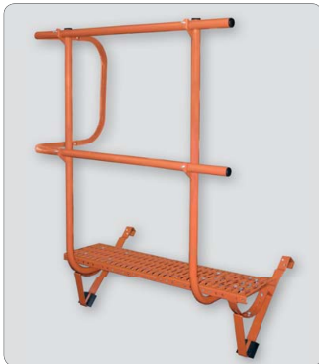
komínová lávka s rohovým zábradlím - provedení v barvě cihlově červené