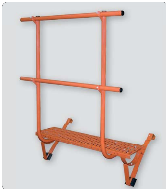
komínová lávka s přímým zábradlím - provedení v barvě cihlově červené