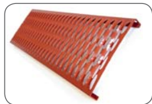
stoupací lávka 1,0 m