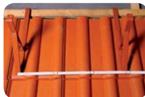
Obr. 2 - Max. rozteč držáků