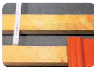
Obr. 1 - Poloha mezilatě pro montáž držáků

Důležité upozornění: Nad sněholamem musí být rozmístěny protisněhové tašky s hákem podle příslušného schéma v závislosti na sklonu střechy a charakteristické hodnotě s_k (dříve základní tíha sněhu s_0 ).